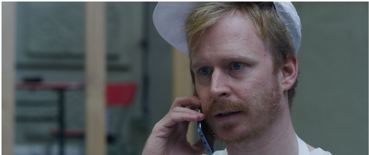
Filmstill «Birds and Dice»