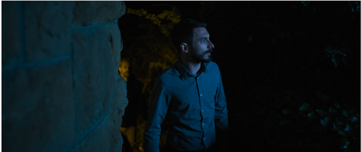
Filmstill «Birds and Dice»