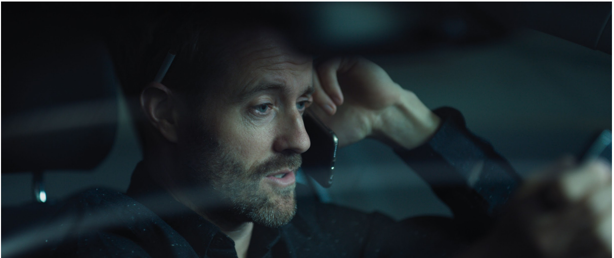
Filmstill «Birds and Dice»